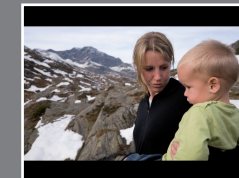
16:9 letterbox dans un 4:3