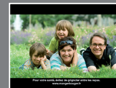
effet letterbox dans un 4:3

L'image HD est nativement 16:9 et n'a pas besoin d'être anamorphosée. Les régies publicitaires '16:9' acceptent également la livraison en HD de spots produits en HD. Attention: la livraison sur un support HD nécessite un encodage spécifique du son (Dolby E).